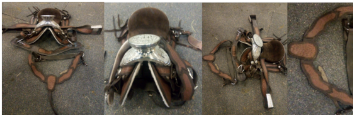
Fotografías 11-14. OC-AV-21-2789 Artículo terminado con piel de Avestruz, especie Struthio camelus 27-10-2021

Valoración técnica inicial del espécimen: ejemplar no vivo, como artículo terminado (silla de montar) que con pintura color café, artículo que contiene los siguientes elementos: cincha, pechera, estribos, axiones, fuste, silla y herrajes. Presenta una placa con la Marca Alpha en el axión y letras HS en el fuste.