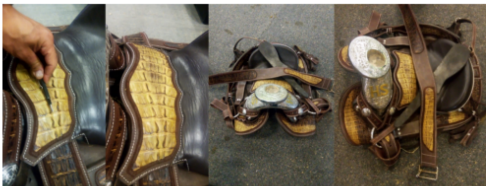
Fotografías 5-7. OC-RE-21-0210 Artículo terminado con piel de Cocodrilo del Orinoco, especie Crocodylus intermedius , 27-10-2021

Valoración técnica inicial del espécimen: ejemplar no vivo como artículo terminado (silla de montar) con pintura amarilla. Artículo que contiene los siguientes elementos: cincha, pechera, estribos, axiones, fuste, silla y herrajes. Marca El Rey sin marquilla, letras HS en el fuste.