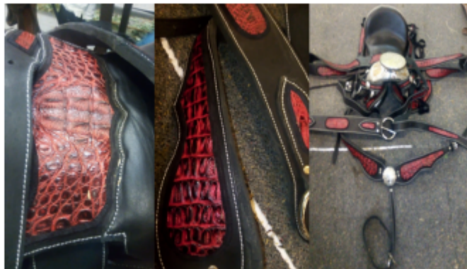
Fotografías 8-10. OC-AV-21- 0211. Artículo terminado con piel de Babilla, especie Caiman crocodylus 27-10-2021

Valoración técnica inicial del espécimen: ejemplar no vivo, como artículo terminado (silla de montar) con pintura roja. Artículo que contiene los siguientes elementos: cincha, pechera, estribos, axiones, fuste, silla y herrajes. Marca El Rey sin marquilla, letras VB en el fuste.